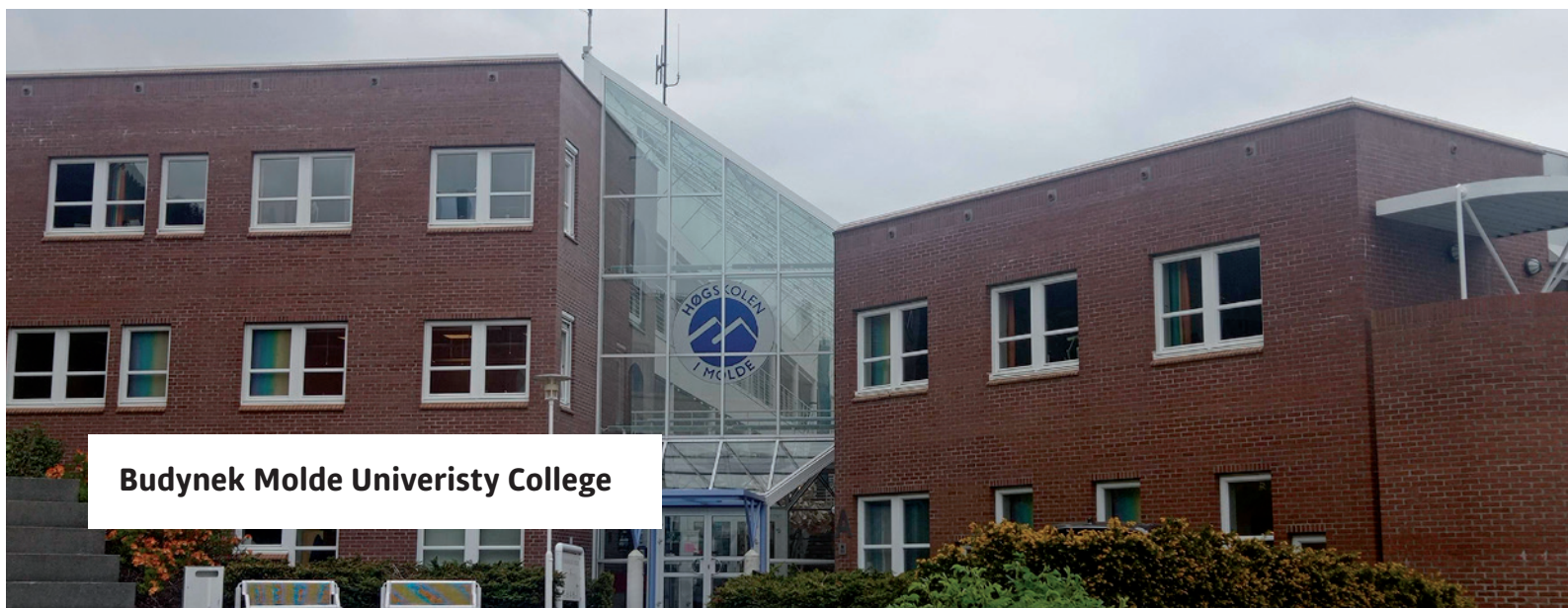
Budynek Molde Univeristy College

Trzydniowy pobyt w Molde był niecodzienną okazją aby doświadczyć i docenić walory przyrodnicze, elementy dziedzictwa kulturowego miasta i kraju, podejście do rozwiązań ekologicznych m.in. w transporcie publicznym oraz wykorzystania rozwiązań informatycznych w wielu strefach życia gospodarczo-społecznego Norwegii.